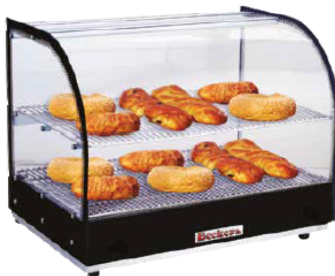
mod. DHN 500