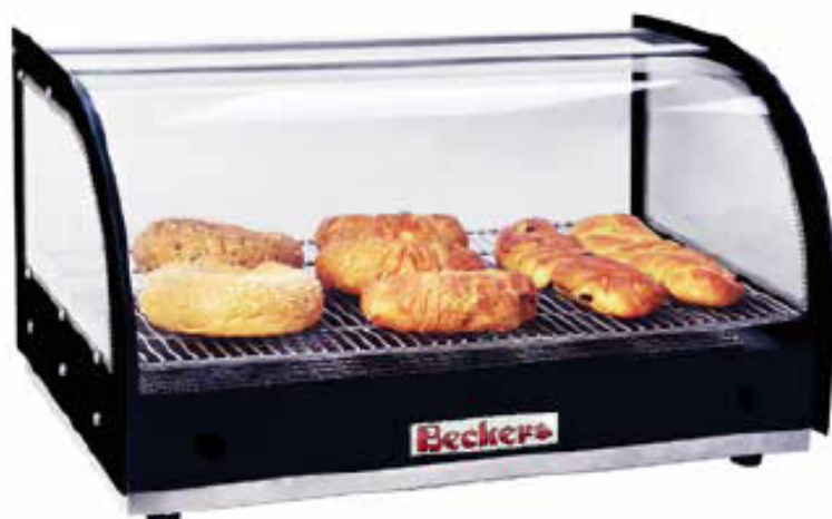
mod. DHN 300

Stainless steel base Tempered glass sides and curved glass front Heating System with resistance Water reservoir at the bottom to add humidity when needed Extra deep reservoir GN 1/9 x 2.5" to last for whole day Rubber seal between front and side glass to prevent heat loss Heating indicator