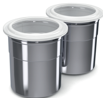
2 contenitori in acciaio cromato con tappo