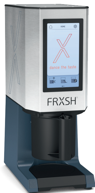
FRXSH Mousse Chef con contenitore di protezione