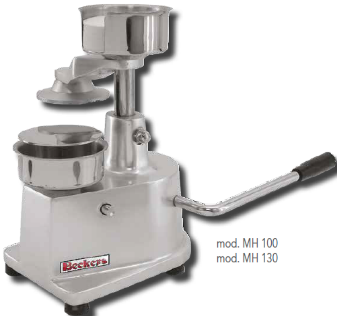
mod. MH 100 mod. MH 130