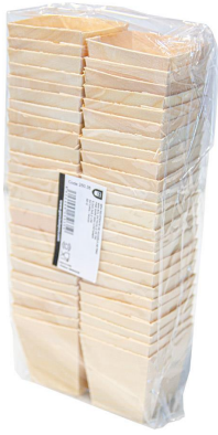
Immagine del pacchetto