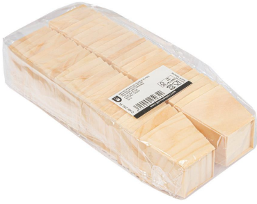
Immagine del pacchetto